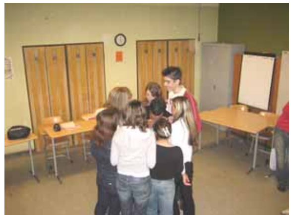
Szenen aus der Übung "Der Bannkreis"