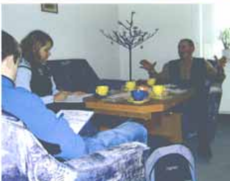
Eine Schülerin und ein Schüler bei einem Senior zu Hause.