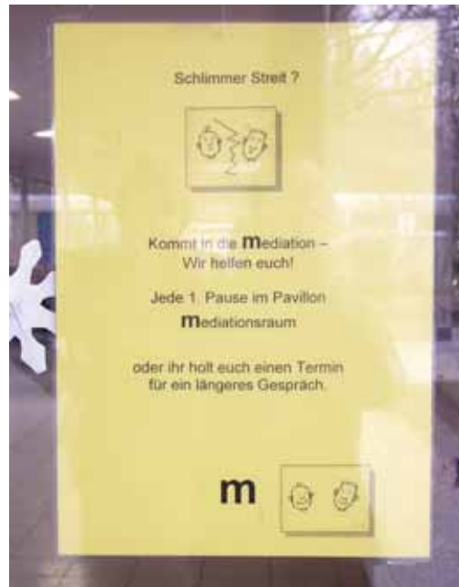
Abb. 3: Mediationsaufruf