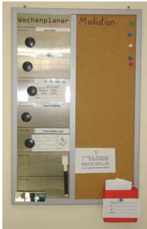
Abb. 4: Wochenplaner