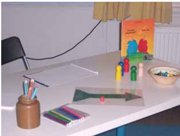
Abb. 2: Mediationsmaterial