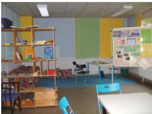
Abb. 1: Mediationsraum