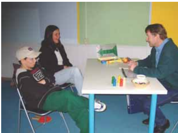
Abb. 5: Mediationsgespräch