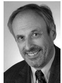
Rainer K. Silbereisen