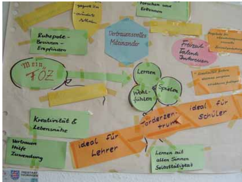
Visionen unseres FÖZ.