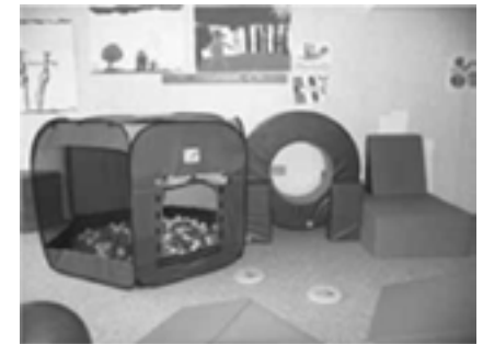
Motorikraum im Förderbereich