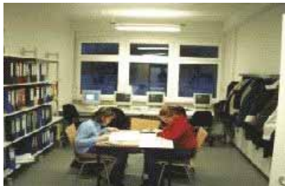
Schüler bei der Freiarbeit.

Darüber hinaus erfolgte gemeinsam mit der Schulleitung eine Verständigung darüber, dass Freiarbeit künftig im Rahmen einer wöchentlichen Doppelstunde anstelle des in der Stundentafel vorgesehenen Förderunterrichts erfolgen soll. Freiarbeitsmaterialien wurden unter Nutzung einschlägiger Verlage von den Mitgliedern der Fachkonferenz selbst angefertigt oder in die Verantwortung der einzelnen anderen Fachkonferenzen gegeben. Dafür wurden die Kollegen von der Schulleitung einzelne Tage vom Unterricht freigestellt, um sich intensiv mit der Erstellung von Materialien beschäftigen zu können.