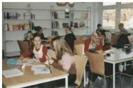
Schüler beim Methodentraining.

Das Methodentraining im Rahmen der Freiarbeit wird am Ende der 7. Klasse mit einer Präsentation der Ergebnisse der Arbeit an einem frei gewählten Thema abgeschlossen. Für die Erarbeitung haben die Schüler das zweite Schulhalbjahr in der 7. Klasse Zeit. Die Arbeit findet in Kleingruppen statt und wird im Wesentlichen in der wöchentlichen Doppelstunde Freiarbeit erledigt. In dieser Phase wenden die Schüler ihre zuvor während des Methodentrainings erworbenen Kenntnisse und Fähigkeiten an.