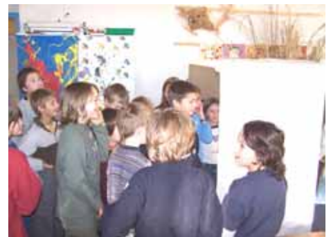
Verwirklichungs- und Praxisphase