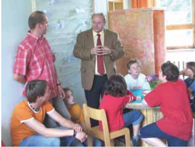
Der Oberbürgermeister erzählt.