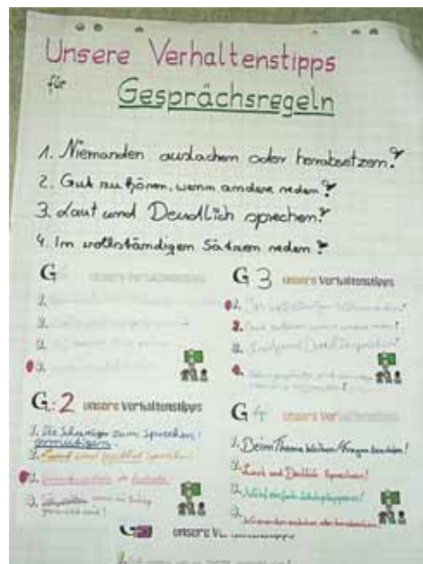
Arbeitsergebnisse Klasse 7.

Dass die Lehrer an diesem Vormittag kaum in Erscheinung traten, wirkte sich positiv auf die anschließende Erarbeitung gemeinsamer Regeln im Klassenraum aus, da die Schüler sie als „ihre eigenen“ Vereinbarungen (auch in der Formulierung!) erarbeiteten.