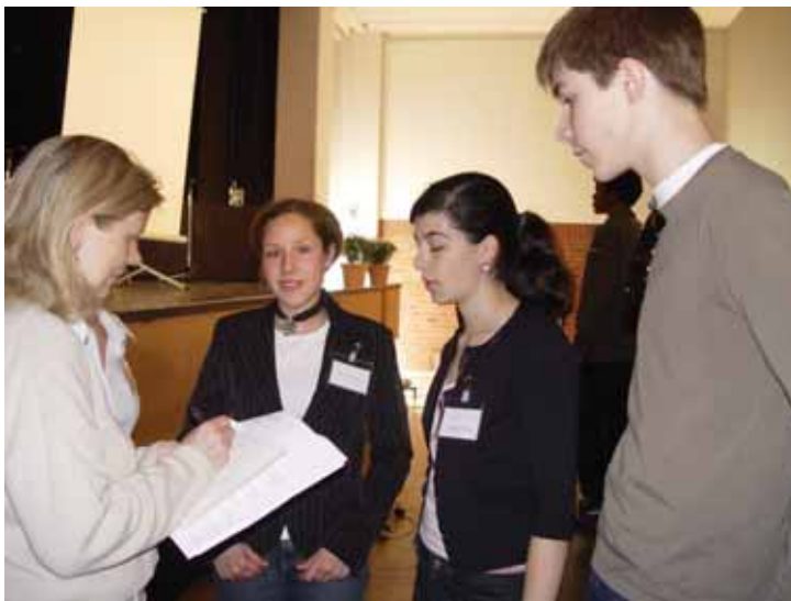
Eine Journalistin interviewt Schüler/innen