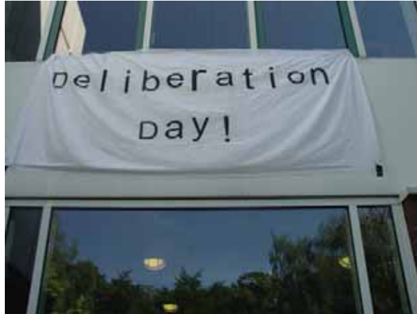
Plakat vom Deliberationstag an der Schulfassade.

Deliberation ist eine Form der politischen Meinungsbildung, bei der kontroverse Themen abwägend diskutiert und Entscheidungen so ausgehandelt werden, dass es zu einem möglichst breiten Konsens kommen kann. Deliberieren und debattieren sind Formen des demokratischen Sprechens aus dem Bereich der Civic Education und Teil der Förderung zivilgesellschaftlichen Verhaltens. Deliberationsforen werden in den USA auf politischer Ebene gezielt als unterstützende Maßnahme der Wissens- und Meinungsbildung eingesetzt.