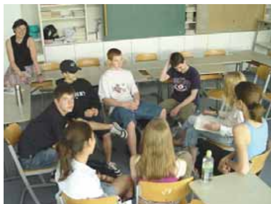
Arbeitsgruppe von Schüler/innen bei der Themenarbeit.

Die Auswahl der Deliberationsfrage „Terrorismus in Deutschland / Ist Deutschland durch Terrorismus besonders gefährdet?“ erfolgte in einem langen, kreativen Prozess. Jeder Schüler konnte drei Themen zur Wahl einbringen. In Kleingruppen wurden anschließend die bevorzugten Themen ausgewählt.