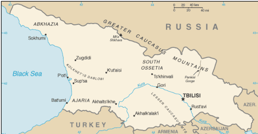
Karte 1: Wichtige Städte in Georgien