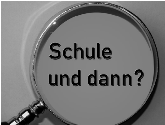
Abbildung 12 Eine berufliche Perspektive ist eine große Motivation für Weg- oder Zuzugsüberlegungen.

Qualitativ betrachtet, werden sowohl im „Bildungsbericht Berlin-Brandenburg 2010“ als auch im „Nationalen Bildungsbericht 2010“ verschiedene Aspekte benannt, die die Bildung im ländlichen Raum betreffen. So sind beispielsweise „trotz deutlichen Anstiegs der Weiterbildungsmaßnahmen der BA weiterhin Probleme mit der Eingliederung in den Arbeitsmarkt“ 17 zu verzeichnen und hier insbesondere Frauen, Ältere und Teilnehmer/-innen in Ostdeutschland betroffen. Es kristallisieren sich somit besonders für die Menschen im östlichen ländlichen Raum die sogenannten „Maßnahme-Karrieren“ heraus, die auch langfristig eine Eingliederung in den Arbeitsmarkt nicht erwirken können.