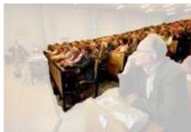
Abbildung 8: Die Masse