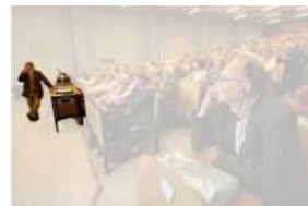
Abbildung 9: Referent