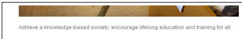
Abbildung 3: Ausschnitt mit Bildunterschrift

Beide bedingen sich gegenseitig und unterliegen einer wechselseitigen Bezugnahme. Einerseits handelt es sich hierbei eventuell um eine durch die veröffentlichende Stelle in Auftrag gegebene Fotografie, andererseits wird das Bild gerade durch die Auswahl des Bildes und durch den Kontext seiner Veröffentlichung zusätzlich mit Bedeutung aufgeladen.