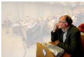
Abbildung 7: Repräsentant

Nicht nur durch die Perspektive der Aufnahme, sondern auch durch die szenische Choreographie wird der Herr im Vordergrund herausgestellt. Er hebt sich auch durch den Abstand zu seinen Nachbarn ab (Abbildung 7). Die zweite choreographische Komponente nehmen die Menschen hinter bzw. neben ihm ein (Abbildung 8). Diese erscheinen wie eine geschlossene Masse von Köpfen. Als drittes bildet die einzig stehende Person eine choreographische Einheit, welche zwar vor der Masse steht, aber dennoch Teil des Hintergrundes ist (Abb 9).