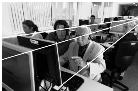
Abb. 2: Perspektive