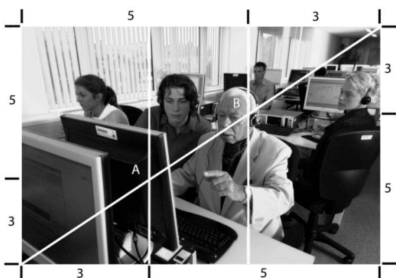
Abb. 3: Goldener Schnitt und Schnittpunkte