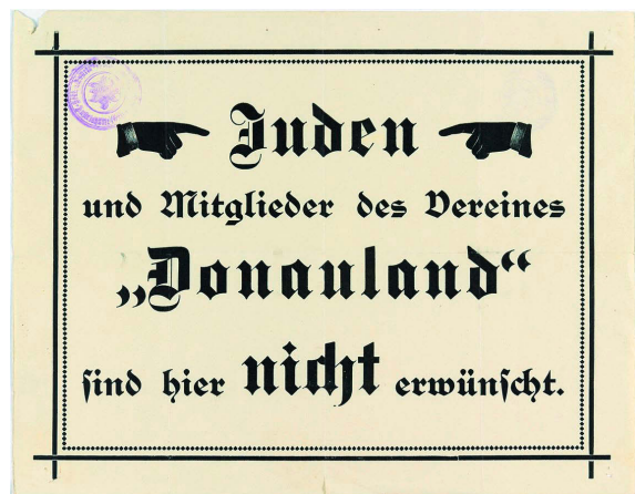
Abb. 1: Antisemitisches Plakat, das in Anlehnung an die Kärntner Plakate an zahlreichen österreichischen AV-Höhlen affiziert war, 1921/22

und „selbstverständlich auch der Antisemitismus“ (AchRAINER 2009, S. 301), den man sich selbst vom Hauptausschuss nicht verbieten lassen wollte. Mit 53 gegen 6 Stimmen wurde im Jahr 1920 die Einführung des sogenannten „Arierparagraphen“ beschlossen, der NichtarierInnen eine Aufnahme in den Verein verweigerte. Und 1923 prangten erstmals Tafeln mit der Aufschrift „Juden ist der Eintritt verboten“ auf den Höhlen des Dobratsch/Dobrač, auch wenn der Hauptausschuss das nicht akzeptierte. Letztlich wurde der Wortlaut „Der Zutritt von Juden ist nicht erwünscht“ (vgl. ebd.) gewählt und dem Hauptausschuss als unumstößlicher Beschluss kommuniziert.