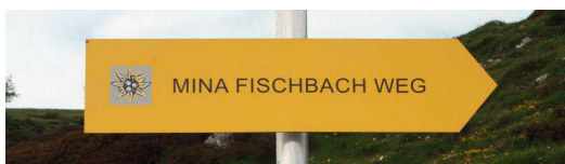
Abb. 5: Weg der Namen