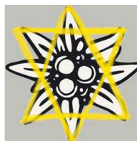
Abb. 7: Modifiziertes Alpenvereinslogo

Die Ebene der Reflexion benenne ich hierbei bereits als andragogischen Wert. Folgend soll exemplarisch und implizit über das Projekt und die Aktion Haus-Berg-Verbot nachgedacht, reflektiert und assoziiert werden. Kunst und Kunstaktionen bieten die Möglichkeit für breite Interpretationen – ich biete hier meine Reflexion an, welche weder auf Vollständigkeit beharrt noch andere Interpretationen ausschließen will. Vielmehr sollen diese Gedanken einen Anstoß zu eigenen Gedanken geben, aber auch einen Raum für Fragen eröffnen.