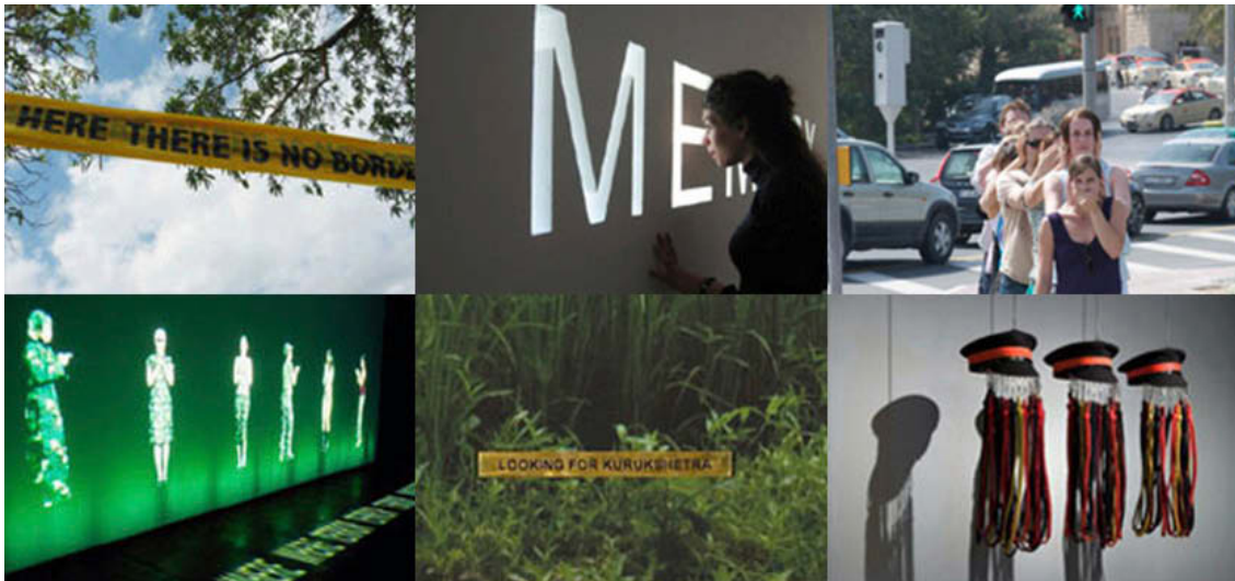
Abb. 4: Shadow 3. Interactive video projection incorporating the viewers simulated shadow von Shilpa Gupta 2007