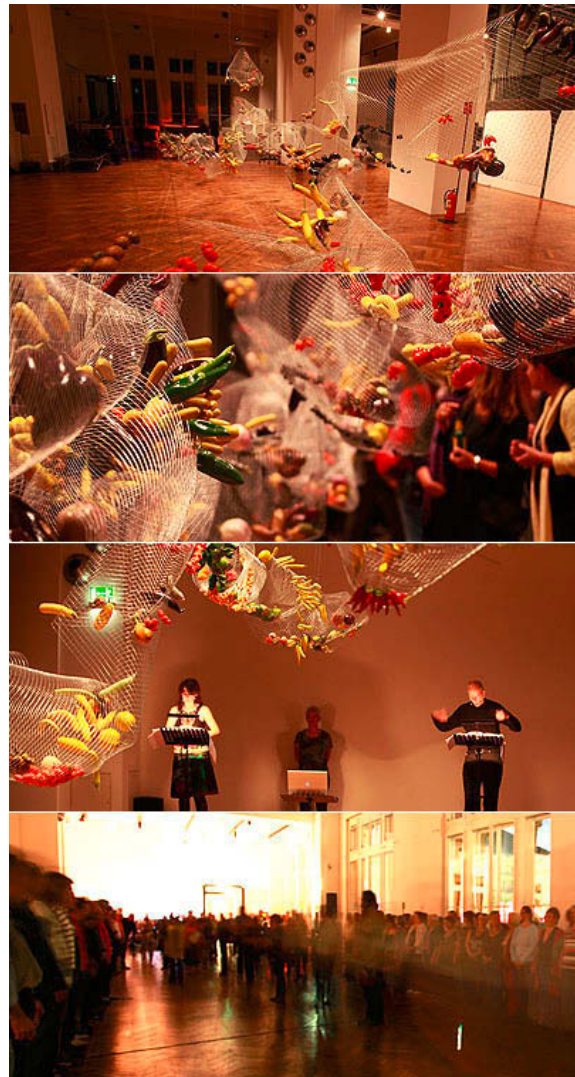
Abb. 1: „Varieties“ – Installation mit Nachtschattenfrüchten 2009 im MAK Wien von Pia Palme