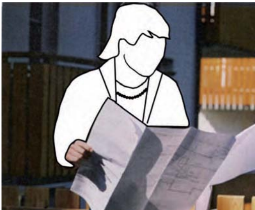
Abb. 4: „Neue“ Frauenrollen darstellen – und damit einen (weiteren) Teil der gesellschaftlichen Realität abbilden

Wenn Bilder als Illustrationen für konkrete Tätigkeiten ausgewählt werden, ist bei der Auswahl besonders darauf zu achten, dass nicht gängige Geschlechterzuschreibungen wiederholt und reproduziert werden.