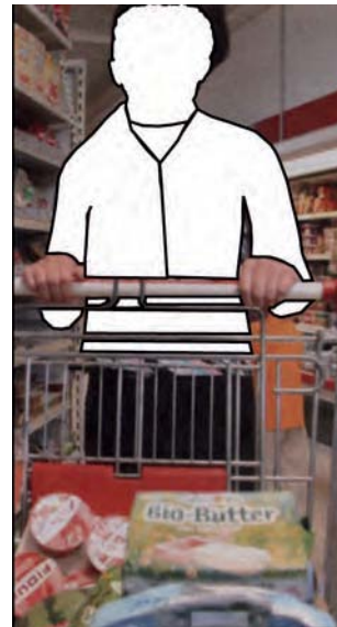
Abb. 5: „Neue“ Männerrollen darstellen – und damit einen (weiteren) Teil der gesellschaftlichen Realität abbilden