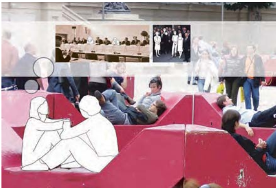
Abb. 1: Blickpunkt Gender

Die Handreichung „Blickpunkt Gender. Leitfaden zur Mediengestaltung“ (siehe Knoll/Szalai 2007) richtet sich an jene Menschen, die mit der Erstellung von Medien im weitesten Sinne zu den Themen Umwelt sowie Nachhaltige Entwicklung zu tun haben – vom Verfassen eines Artikels oder einer Pressemeldung bis hin zur Gestaltung einer Zeitschrift oder eines Folders. Der Leitfaden unterstützt mit umsetzungsorientierten Beispielen und praktischen Tipps bei der gendersensiblen Gestaltung sowie bei geschlechtergerechter sprachlicher und bildlicher Darstellung in den Medien.