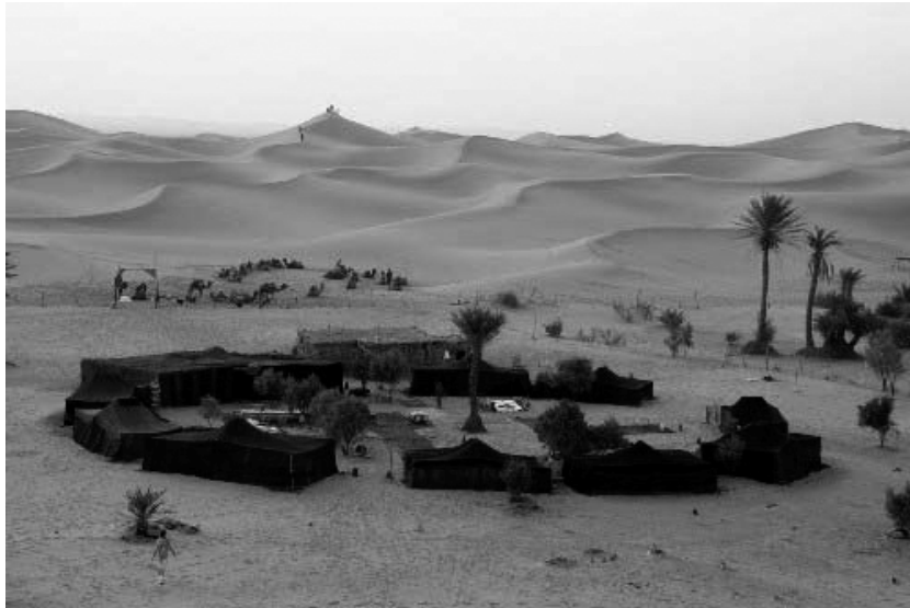
Abb. 1: Impulsbild „Wüste“

Als thematischer Bezugsrahmen diente die Vorstellung einer Wüstenexpedition . Die situative Rahmung ermöglichte es den Kindern, ihre individuellen Vorstellungen, Erfahrungen und Wünsche im Zusammenleben mit Gleichaltrigen einfließen zu lassen. Sie öffnet den Raum, um soziale Prägungen und internalisierte Muster sichtbar werden zu lassen. Als thematischer Impuls wurde den Kindern via Overhead ein Wüstenbild (Abb.1) gezeigt. Sie sollten sich vorstellen, mit 9 anderen Kindern vier Wochen in der Wüste zu verbringen. Eine Szene dieses Zusammenlebens sollte nun gezeichnet werden. In einer weiteren Unterrichtseinheit schrieben die Kinder einen Text über den Lageraufbau in der Wüste. In beiden Unterrichtsstunden wurden die Interaktionen der Mädchen und Jungen beobachtet, anhand des Sitzplans grafisch nachvollzogen und dokumentiert. Auf Basis von Bohnsacks Kriterium der maximalen Kontraste (1989, S. 18) für die Konturierung von Typiken wurden nach einer ersten Sichtung des gesammelten Materials vier bis sechs unterschiedliche Zeichnungen pro Klasse ausgewählt. In den anschließenden Einzelgesprächen sollten die Kinder ihre Bilder erklären, Auskunft geben über die Stimmungen der handelnden Personen und beschreiben, wie die Szene weitergehen könnte.