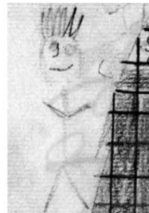
Abb. 6: M17m – Kind