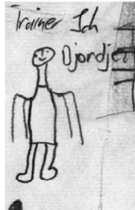
Abb. 5: M17m – Am Weg zum Er- wachsenen