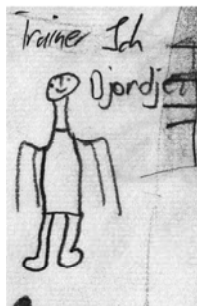
Abb. 5: M17m – Am Weg zum Er- wachsenen