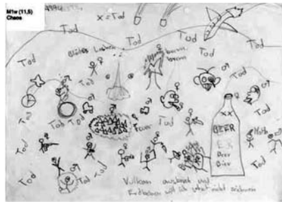
Abb. 2: M1w (11,5) Chaos