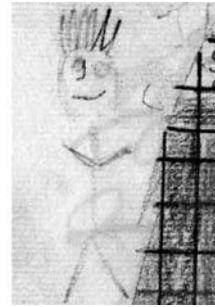
Abb. 6: M17m – Kind