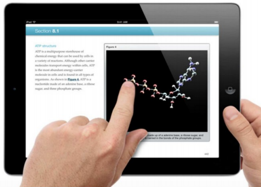
Abbildung 2: Ausschnitt der Apple Webseite zu E-Schulbüchern

Readers can manipulate 3D objects with a touch — so instead of seeing a cross section of a brain, they can see all sections. iBooks Author gives book creators the option to adjust the background, allow readers to rotate the object freely, or constrain its movement to horizontal or vertical rotation.