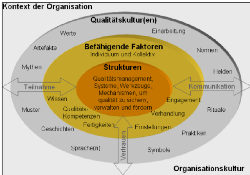
Abbildung 3: Qualitätskulturmodell

Hochschulen würde eine Analyse von Qualitätskultur mit der Frage beginnen, wie Hochschulen die Herausforderung, Qualität in einem bestimmten Bereich zu verbessern, zum Beispiel dem des Lehrens und Lernens oder der Forschung, verwirklichen. Das Qualitätskulturmodell bietet demnach einen konzeptuellen Rahmen, der bei der Analyse von Konzepten und Entwicklungen in verschiedenen Bereichen, die für Qualitätskultur wichtig sind, hilfreich ist. Zudem hilft es auch dabei Stärken und Schwächen zu identifizieren.