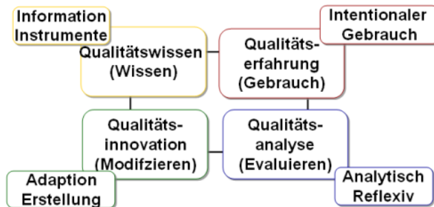
Abbildung 5: Qualitätskompetenz (Ehlers 2007)