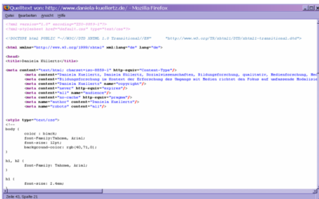
Abbildung 1: Auszug Quellcode, index.html www.daniela-kuellertz.de

ichnete Phänomene sind Pop-Up-Fenster und Spam als narrativer Zwang (vgl. a.a.O.), oder die Transparenz der Produktion von Internetseiten durch die Sichtbarkeit des Quellcodes, was als Demokratisierungsprozess der Veröffentlichung interpretiert wird. Ebenso wird auf die Varianz der Ausgabe einer HTML-Seite in verschiedenen Browsern (relative Kontrolle ist hier nur über Alternativ- Tags möglich) hingewiesen.