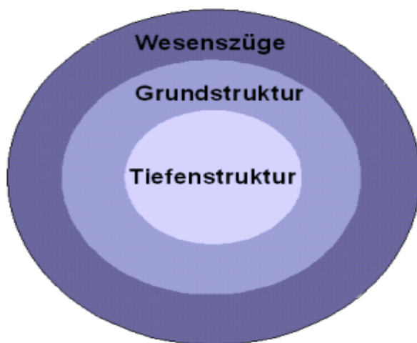
Abbildung 1: Modell der Persönlichkeit als Baumquerschnitt

Weil es bisher kein förderdiagnostisches Verfahren zur Ermittlung der veränderbaren Anteile der Persönlichkeitsstruktur gab, haben wir dieses in den vergangenen Jahren entwickelt. Dabei ist der Persönlichkeitsstrukturtest PST [4] (vgl. Dieterich, M. 2003, 37 ff) entstanden, dessen Aufbau nachfolgend kurz skizziert wird.