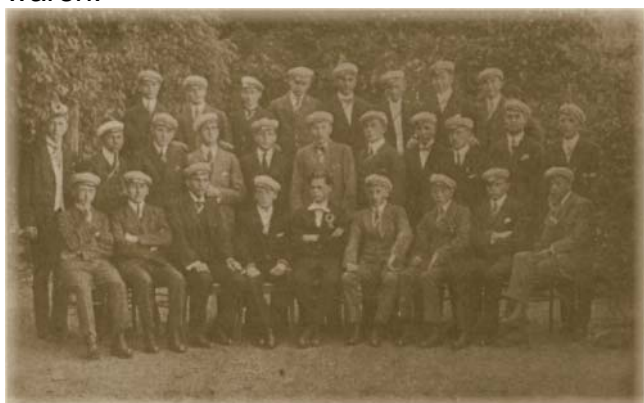
Abbildung 1: Der Homberger Seminarjahrgang 1920-1923 anlässlich des Bergfestes 1921

Zum 25-jährigen Jubiläum ihrer Entlassung aus dem Lehrerseminar in Homberg/Efze[3] trafen sich 1948 Absolventen der Ausbildungsklasse 1920 bis 1923 zu einer Wiedersehensfeier. Bei der Gelegenheiten vereinbarten sie, sich in untereinander zirkulierenden Briefen ihre Lebensgeschichten zu erzählen. [4] Nach und nach wurden alle 29 Überlebenden der Abgangsklasse[5] in das Vorhaben einbezogen. So entstand eine rund 400 hand- bzw. maschinenschriftliche Seiten umfassende Dokumentensammlung mit Aufzeichnungen zu privaten und beruflichen Lebensläufen, die von einem der Initiatoren gesammelt und durch Angaben zu den Dienstjahren, den Dienstorten, den beruflichen Karrieren sowie zu den Lebensläufen verstorbener Mitschüler ergänzt wurde. Die letzten Eintragungen stammen aus den 1970er Jahren, nachdem die Briefe anlässlich der 50-Jahrfeier des Seminarabgangs noch einmal unter den verbliebenen 15 Teilnehmern in Umlauf gebracht worden waren.