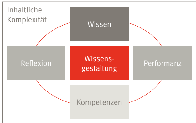
Abb. 2: Stufenmodell (1): Aspekte der Wissensgestaltung.

Der Umgang mit Wissen lässt sich in vier Aspekte der Wissensgestaltung unterteilen (siehe Abb. 2).