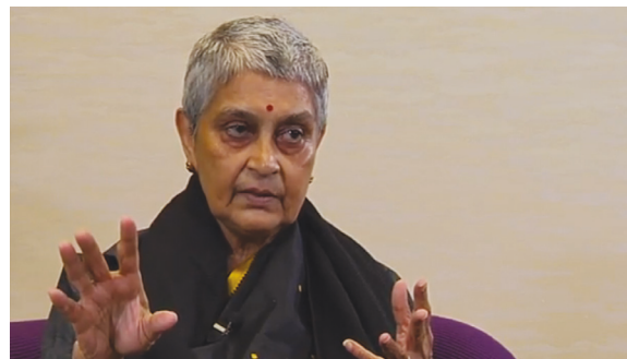
Foto: Standbild Video „Message from Gayatri Chakravorty Spivak – THE 2012 KYOTO PRIZE“ ( http://www.youtube.com/watch?v=n8iPj6qka3o )