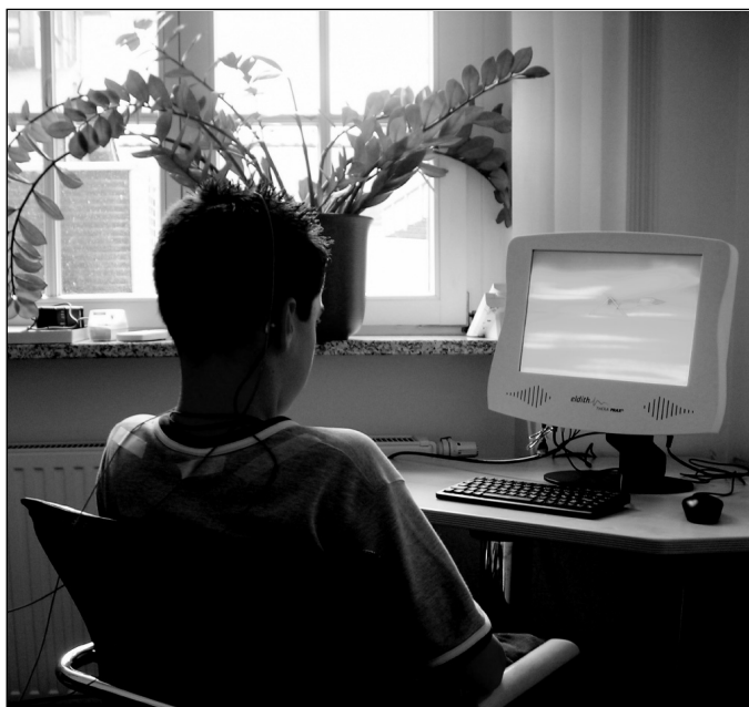
Abb. 1: Kind bei Neurofeedback vor einem Computer.

Die Vorstudie zu Brainfeeders findet 2010 an zwei Förderschulen mit dem Schwerpunkt Lernen statt. Die Hypothesen wurden wie folgt formuliert: