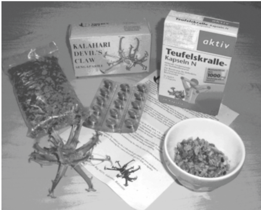
Abb. 1: Beispiele für Produkte, die aus der südafrikanischen Teufelskralle zu Heilzwecken gewonnen und vermarktet werden.

Der Kompetenzbereich „Fachwissen“ wird durch drei Basiskonzepte strukturiert, um die Fülle biologischer Inhalte auf exemplarische Kontexte zu reduzieren. Die drei Basiskonzepte sind „Struktur und Funktion“, „System“ und „Entwicklung“. Vor allem das Basiskonzept „System“ bietet zahlreiche Anknüpfungspunkte für Globales Lernen. Schüler/-innen sollen beispielsweise erkennen, dass lebendige Systeme in Beziehung zu weiteren Systemen der Geosphäre und mit Systemen der Gesellschaft, Wirtschaftssystemen und Sozialsystemen stehen (KMK 2004, S. 8). Auf bildungsformaler und fachwissenschaftlicher Ebene sind also plausible Argumente für die Einbindung Globalen Lernens in den Biologieunterricht gege-