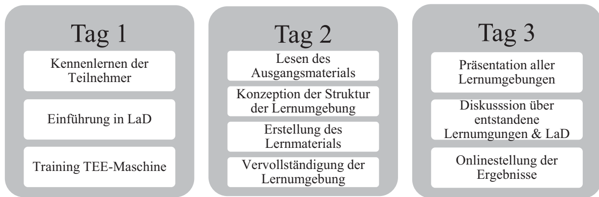
Abbildung 4: Ablauf des Blockseminars

Da prüfungsrelevante Inhalte vermittelt werden sollten, wurden Texte und Bilder für die Teilnehmenden des Seminars bereitgestellt, um den Prozess der Informationssuche zu verkürzen. Dennoch war so viel Ausgangsmaterial vorhanden, dass die Lernenden gezwungen waren zu selektieren, da es nicht möglich war, den gesamten Inhalt in das mediale Produkt einzuarbeiten.