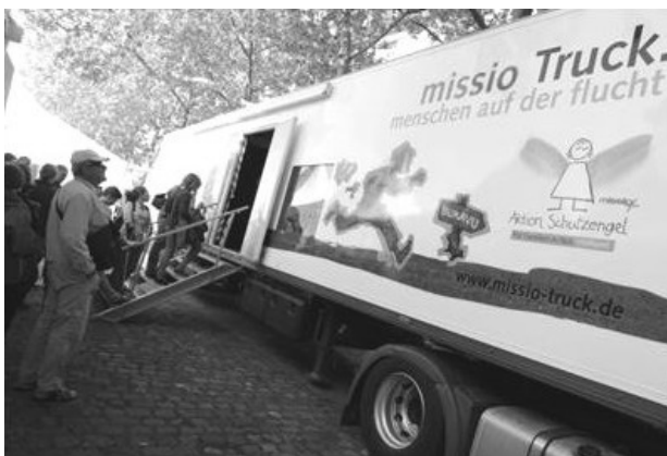
Abb. 1: Besucher vorm missio-Truck „Menschen auf der Flucht“

Keywords: missio, missio-Truck, escape, Aktion Schutzengel