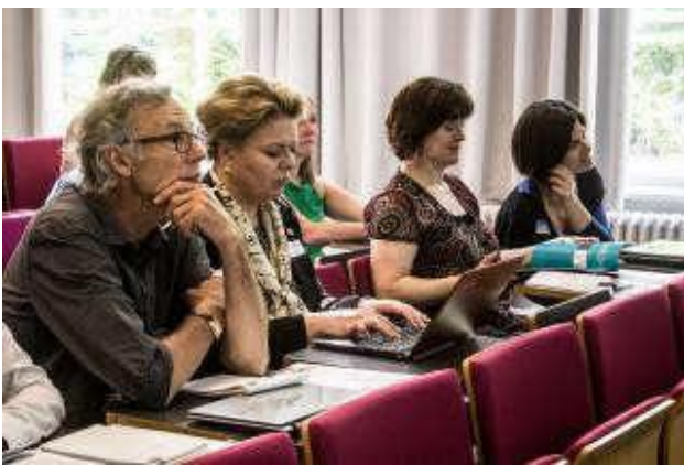
Arbeitsgruppensitzung in Leuven (Belgien)

Modul 2 wurde für Studenten während ihres Auslandsaufenthaltes entwickelt. Es besteht aus 3 Aktivitäten, die helfen sollen, dass sich die Studenten mit dem lokalen Umfeld und der geografischen Lage ihres Aufenthaltsortes einschließlich der akademischen Kultur ihrer Gastgebereinrichtung befassen, um besser zu verstehen, was sie erwartet.