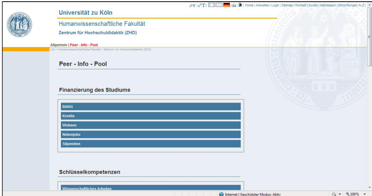
Abb. 2: Screenshot des Peer-Info-Pools

dener Informationsfelder ermöglicht werden, einen Überblick über wichtige Schlüsselkompetenzen für ein Studium zu erhalten (z.B. Ziel- und Zeitmanagement) und diesen mit Hilfe der übermittelten Informationen selbstständig aufzubauen bzw. weiter zu entwickeln.