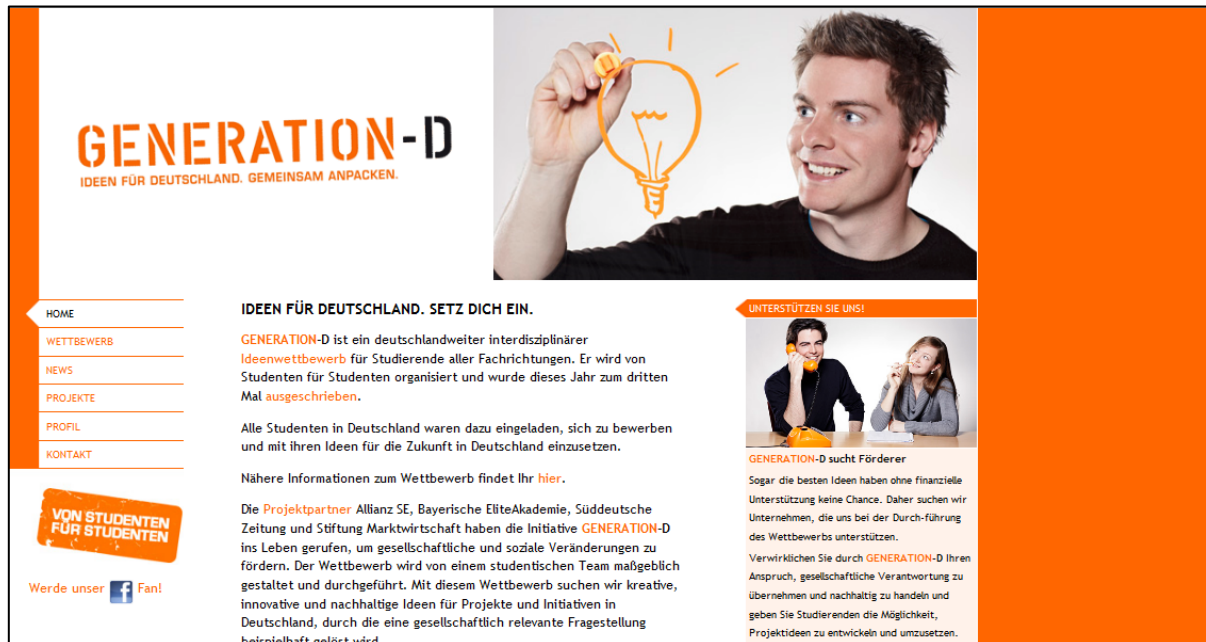
Abb. 1: Screenshot der Homepage von GENERATION-D