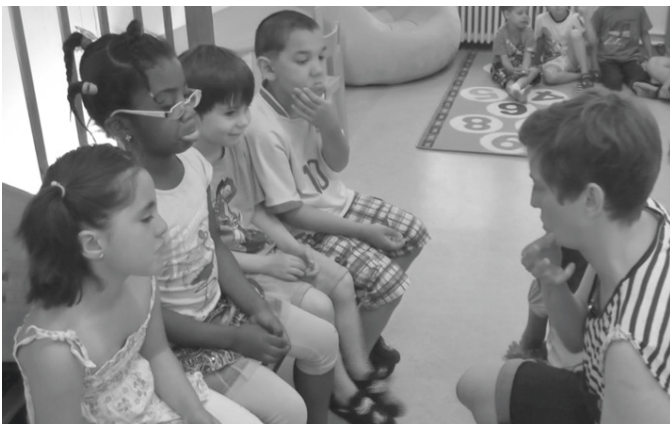
Abbildung 3: Multimodales Interagieren zwischen der Lehrerin und den Lernenden.