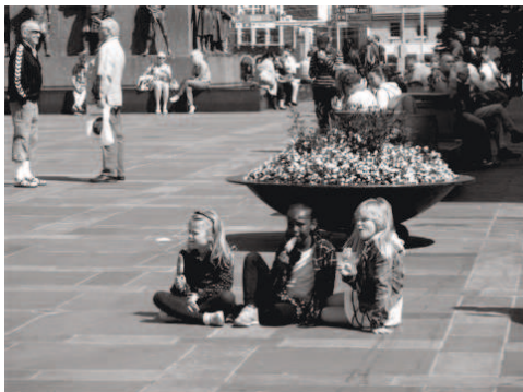
Abb.2: Kinderszene in Bergen

Bei der empirischen Annäherung an die Dynamik des alltäglichen Arrangements ist es hilfreich, sich exemplarisch auf eine typische Szene aus dem Alltagsleben von Kindern, Jugendlichen oder Heranwachsenden zu beziehen. Dabei kommt es darauf an, rekonstruktiv zu verfahren, also aus der Perspektive der Betroffenen zu argumentieren, an deren „empirischen“ Blick anzuknüpfen und erst danach auf Außenansichten einzugehen und die Sicht der im Quartier Aufwachsenden erst ganz zum Schluss mit anderen Sichtweisen bzw. Deutungen zu vergleichen.