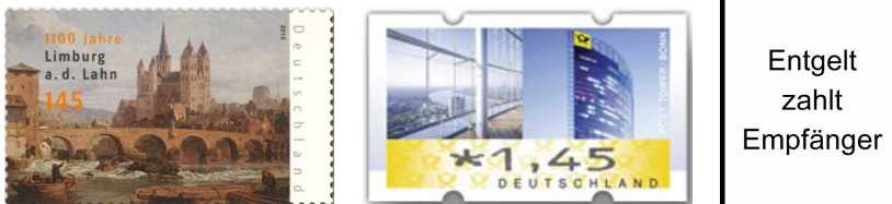
Abbildung 1: Frankierungsvarianten in der Einzelbefragungsvariante zu MZP 6

Anmerkung. Bildquelle zu den Briefmarken: philatelie.deutschepost.de