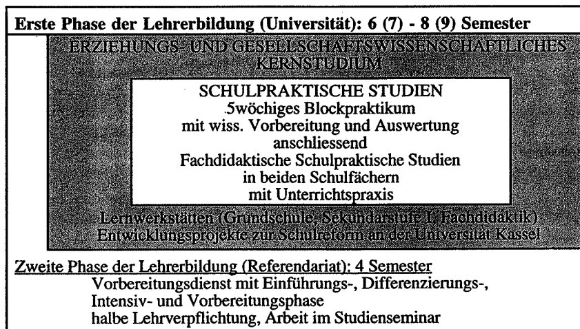
Schema 4: Die Schulpraktischen Studien im Kontext von Lehrerstudium und Referendariat 7