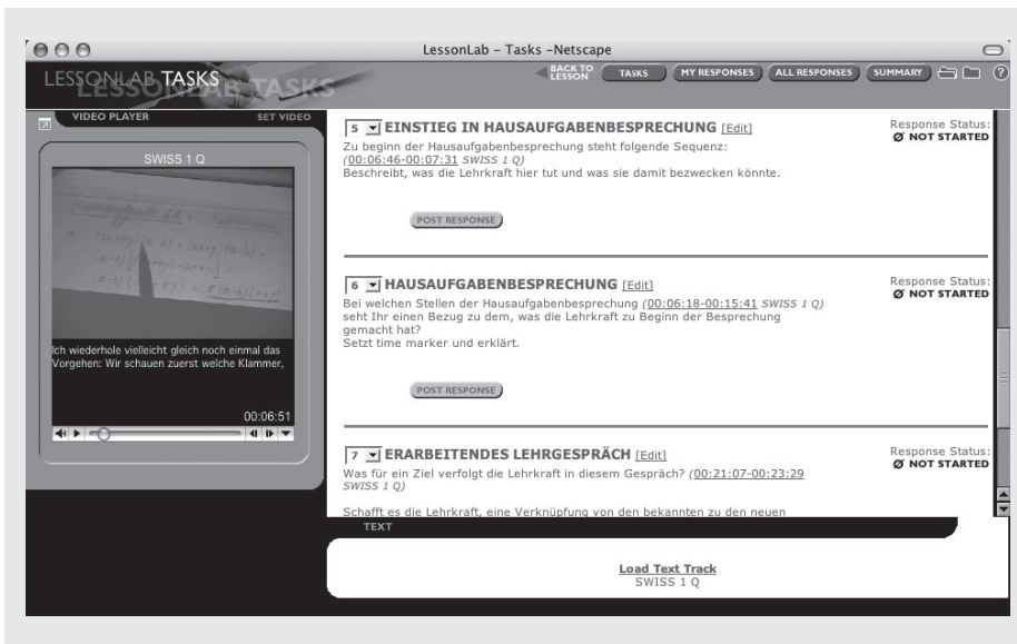
Abbildung 1b: Bearbeiten von Aufgaben zu den Unterrichtsvideos mit LessonLab Software Visibility Platform™.

durch die Software ermöglichte Zeitmarkierungsfunktion (Video-Marker), mit der sich Zusatzmaterialien wie z.B. das Transkript mit Stellen im Video verbinden lassen und die solchermassen den direkten Zugriff zu einer bestimmten Unterrichtssituation über eine Textstelle erlaubt. Mit der Zeitmarkierungsfunktion lassen sich auch Beiträge in den Diskussionsforen der Lernplattform mit dem Video verknüpfen: eine Art digitaler Fingerzeig. Wenn eine Studierende den Beitrag eines anderen Studierenden liest, kann sie sich über die von diesem Studierenden eingefügte Zeitmarkierung die Unterrichtssituation, auf die sich sein Diskussionsbeitrag bezieht, direkt und mehrmals anschauen. Weiter besteht die Möglichkeit, Lernaufgaben mit dem Video zu verknüpfen, die anschliessend durch die Studierenden bearbeitet werden können. Auch hier kommt der Zeitmarkierung eine zentrale Rolle zu, sie ermöglicht einerseits die Verknüpfung von Aufgaben und Unterrichtsvideo, andererseits erlaubt sie den Studierenden, die Antworten zu den Aufgaben mit spezifischen Stellen im Video zu verknüpfen.