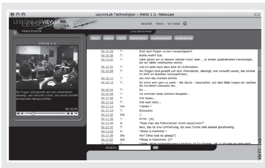
Abbildung 1a: LessonLab Software Visibility Platform™ zum Abspielen der Videos und Betrachten der Transkripte (die Zeitangaben sind Hyperlinks und verweisen direkt auf die entsprechenden Stellen im Video).

Die Software ermöglicht das zeit- und ortsunabhängige Reflektieren und Diskutieren der Unterrichtsvideos. Von zentraler Bedeutung für die Arbeit mit den Videos ist die