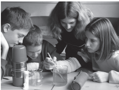
Abbildung 3: Beispiel eines PB-Items für die 6. Klasse zum Handlungsaspekt «Informationen erschliessen» und dem Themenbereich «Planet Erde».

Plane eine Untersuchung, um herauszufinden, welche Wirkungen unterschiedliche Temperaturen auf die Geschwindigkeit haben, mit der sich Brausetabletten auflösen.