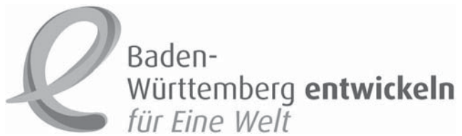
Abb. 1: Logo des baden-württembergischen Eine-Welt-PromotorInnenprogramms

In Baden-Württemberg sind die Strukturen im Nachhaltigkeitsbereich vergleichsweise gut. Denn Nachhaltigkeit ist ein