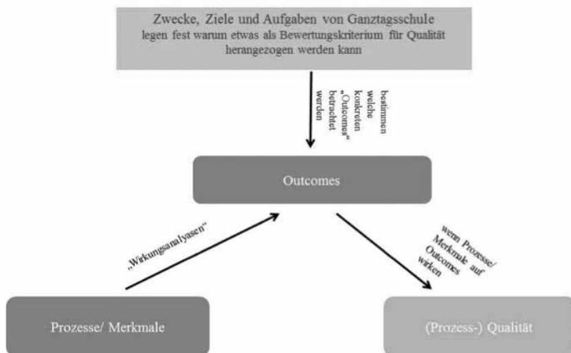
Abbildung 1 Empirische Betrachtung von Qualität: «Empirisch analytisch erklärende Qualitätsbestimmung» am Beispiel von Ganztagschulen

und prüfen deren Effekt sowohl auf fachliches Verstehen als auch auf die Motivationsentwicklung, die somit als Bewertungskriterien für die Qualität des Unterrichts fungieren. Ein anderes Ziel von Unterricht würde demnach zu anderen Qualitätsdimensionen führen. Der dieser Logik zugrundeliegende Modus wird deshalb als empirisch analytische Qualitätsbestimmung (Abb.1) bezeichnet, weil versucht wird, die Zusammenhänge zwischen Merkmalen und bestimmten Outcomes nicht (nur) theoretisch, sondern empirisch zu bestimmen. Diesem Vorgehen folgt auch die oben dargestellte Längsschnittstudie StEG-S. Theoriegeleitet werden Merkmale von Ganztagsangeboten empirisch erfasst und deren Zusammenhänge mit bestimmten Outcomes betrachtet. Beispielsweise «wirken» sich Partizipationsmöglichkeiten in Ganztagsangeboten aus dem Bereich «Medien» positiv auf den Selbstwert der Schülerinnen und Schüler aus (Sauerwein, 2016) und sind nach der Logik des empirisch analytischen Modells deshalb als Qualitätsmerkmal anzusehen. Das normativ gesetzte Zielkriterium «Förderung des Selbstwertes» rechtfertigt zusammen mit der Wirkungsanalyse, «Partizipationsmöglichkeiten» als Aspekt der Qualität von Ganztagsangeboten zu bezeichnen.