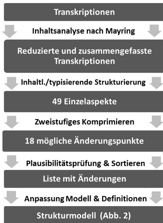
Abbildung 1: Methodisches Vorgehen zur Auswertung der Expertenbefragung

Die Transkriptionen der teilstrukturierten Interviews erzeugten umfassendes empirisches Material (über 160 Seiten), welches mittels einer qualitativen Inhaltsanalyse (Mayring 2010; Kruse 2014) ausgewertet wurde.