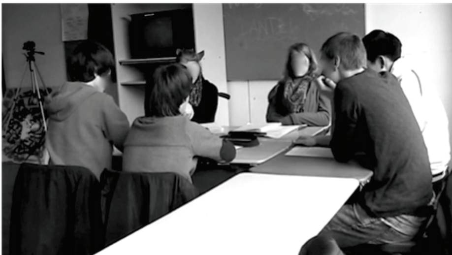
Abbildung 4: Selbstversorgung als Strafe (14:46)