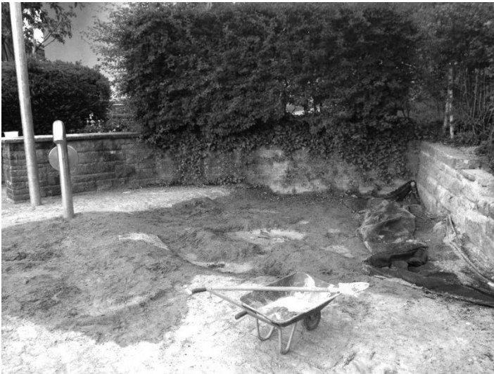
Abbildung 4: Sandkasten mit Schubkarre und Schaufel

Jimmy, der eine Schaufel in der Hand hält an, diese für das Herausschaufeln des Sandes aus der Schubkarre einzusetzen.