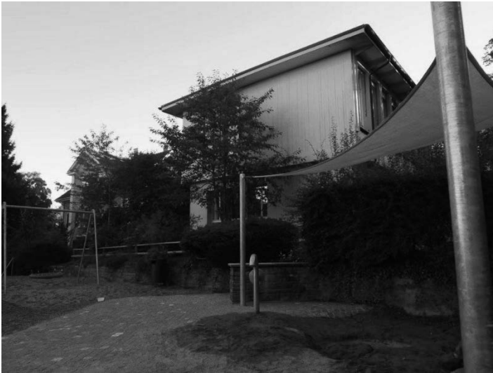
Abbildung 3: Kindergartenaußenraum mit Blick auf die Nestschaukel, Foto: A. Sieber, G. Unterweger

Das Gelände ist eher klein und stark unterteilt, der größte Teil davon ist in Hanglage situiert. Ein Rundgang mit der Kindergruppe und der Kindergartenlehrerin 7 zu Beginn des Schuljahres macht einige Reglementierungen deutlich, die auf dem Areal gelten: Es gibt eine angrenzende (praktisch verkehrsfreie) Straße, die nicht als Spielort benutzt werden darf, einen Rasen, der nur dann betreten werden darf, wenn der Schulhausabwart 8 es erlaubt, und es gibt die Grenze zum benachbarten Schulhausareal, die nur unter Anwesenheit der Kindergartenlehrperson überschritten werden darf. Auch wenn in der Schweiz der Kindergarten die ersten zwei Jahre der Schuleingangsstufe umfasst und somit in die obligatorische Schulzeit integriert ist, werden zwischen der „Schule“ und dem „Kindergarten“ diverse Trennlinien gezogen. Dies spiegelt sich auch in der Außenraumgestaltung wider, was zur Folge hat, dass einige Spielgeräte auf dem Schulhausareal für einige Kinder eine große Attraktivität ausüben. Das ist insbesondere beim Klettergerüst der Fall, das vom Kindergartenaußenraum stets in Sichtweite der Kinder liegt, aber nur unter Begleitung und steter Aufsicht der Kindergartenlehrperson benutzt werden darf. Umgekehrt übt die