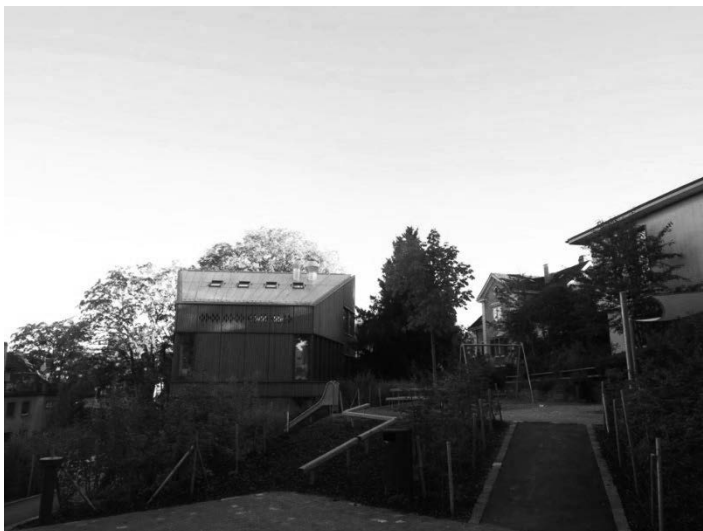
Abbildung 2: Kindergartenaußenraum mit Balancierholz