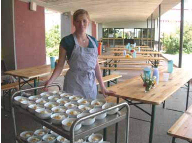
Schülerin in der Cafeteria bei der Essensausgabe.