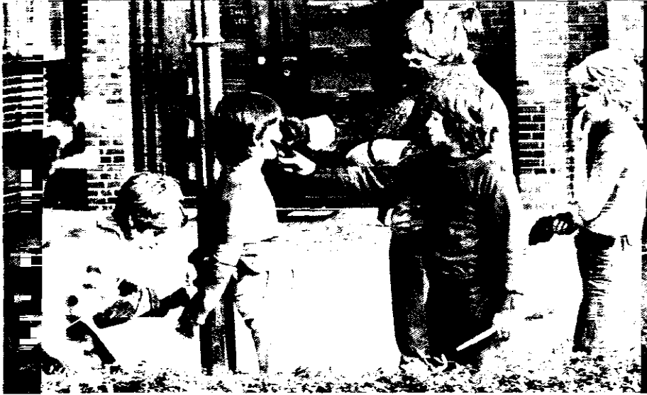
Kinder spielen Medienerlebnisse nach