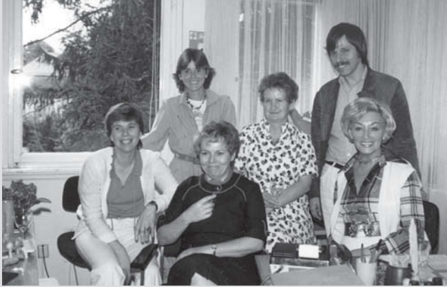
Ein wissenschaftlicher Mitarbeiter und seine nicht-wissenschaftlichen Kolleginnen Mitte der 1970er Jahre.

„Der Anteil von Frauen und Männern soll perspektivisch auf allen Hierarchiestufen jeweils 50 % betragen (drei Hierarchiestufen: Leitungsebene, wissenschaftliche Mitarbeiterinnen und Mitarbeiter, Sachbearbeiter).“ (DIE-Programmbudget 2009)