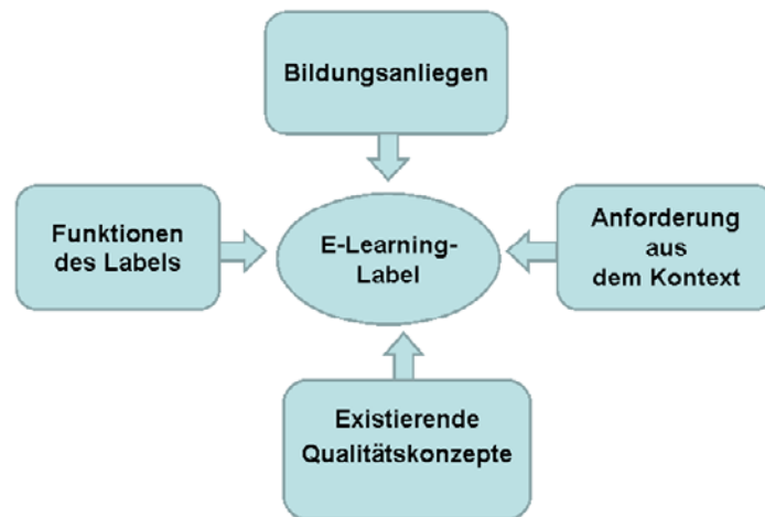
Abb. 1: Die Konzeption eines Qualitätsmodells unterliegt verschiedenen Einflüssen. Vorhandene Konzepte werden meist nur adaptiert.

Grund dieser Bedingungsfaktoren ist es schwierig, wenn nicht sogar unproduktiv, existierende Qualitätskonzepte 1:1 zu übernehmen. Vorhandene, wenn auch erfolgreiche Konzepte und Modelle können vielmehr nur Orientierung bieten.