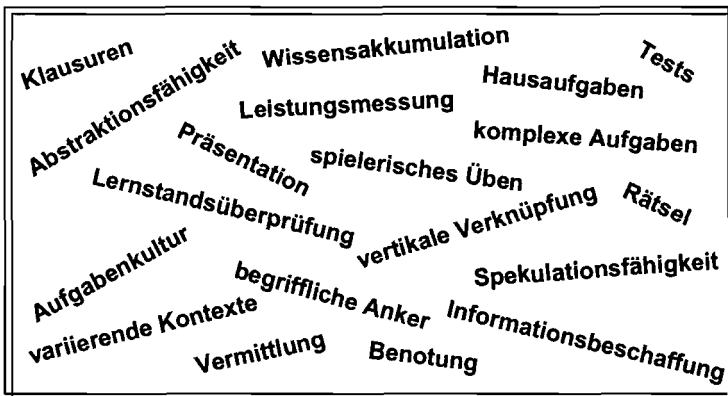
Grafik 1: Begriffliche Kontexte

Aufgaben sind geeignet, um die unmittelbare Auseinandersetzung der Lernenden mit den Lerngegenständen und den Methoden des Lernens zu gewährleisten. Hierbei werden unterschiedliche und jeweils geeignete Aufgabenformate zu wählen sein. Beiden Orientierungen gemeinsam ist