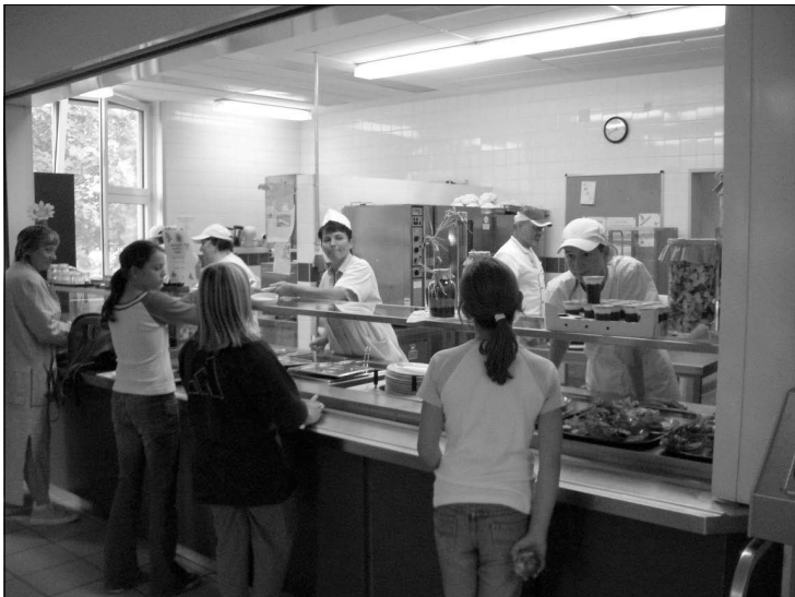
Das Küchen- Team der HES

Die Teilnehmer/innen kommen aus der Altersgruppe der 18- bis 60-Jährigen und sind internationaler Herkunft. Zu Beginn wurden vorzugsweise Frauen aus dem Stadtteil in das Projekt eingebunden. In der Qualifizierung von Langzeitarbeitslosen bildet Aneignung von sozialen Kompetenzen die Grundlage für alle weiteren Qualifizierungsschritte. Die Aneignung eines Mindestmaßes an so genannten Arbeitstugenden, vor allem Pünktlichkeit und Zuverlässigkeit bilden eine weitere Grundlage für den Erfolg der Maßnahme. Der Umgang mit Vorgesetzten, Kollegen und Gästen erfordert Sensibilität und Einfühlungsvermögen.