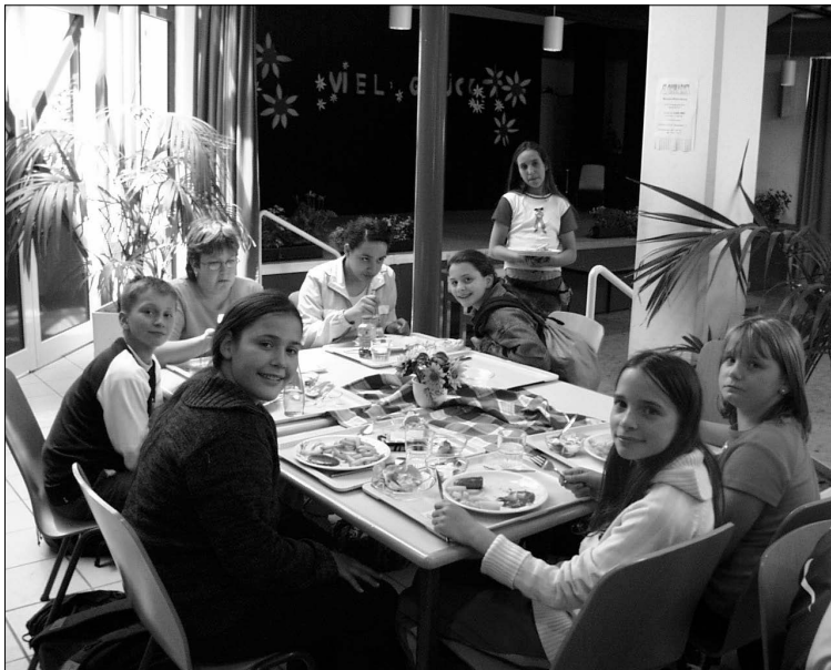
Mensa der Hermann-Ehlers-Schule, Schüler beim Essen, Foto: G. Seelmann-Eggebert

Dabei sind die Tische so angeordnet, dass sechs bis acht Kinder an einem Gruppentisch sitzen können und die Kommunikation zwischen den Teilnehmern beim Essen erleichtert wird. Die Begleitung der Schüler durch ihre Klassenlehrer/innen, vor allem in den Klassen 5 und 6 fördert die Esskultur, führt aber auch zur Verbesserung der Klassenstruktur und des Klassenklimas und verbessert damit die pädagogische Arbeit in den Klassen.