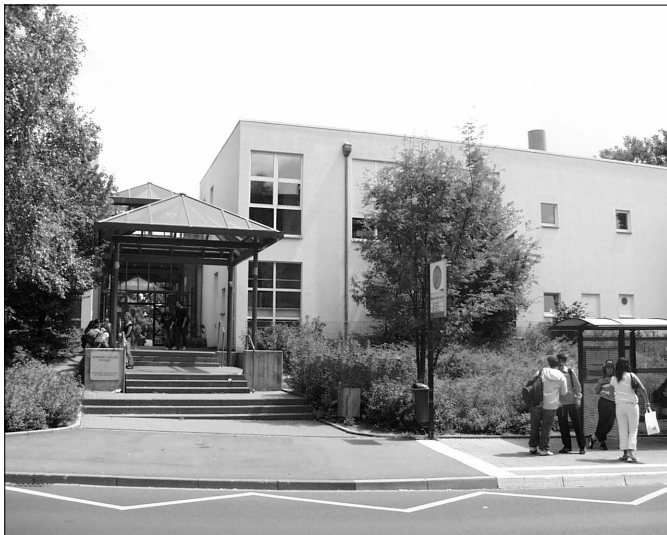
Eingang zur HES, Foto: G. Seelmann-Eggebert

Dies ist kein Traum, sondern tägliche Wirklichkeit an der IGS Hermann-Ehlers-Schule, einer Ganztagsschule, in Wiesbaden-Erbenheim. Das Mittagessen hat in der HES bei den Schülerinnen und Schülern eine hohe Akzeptanz, obwohl das Essen in der Zusammensetzung den Prinzipien einer ausgewogenen und gesunden Ernährung entspricht und kein Fastfood angeboten wird. Doch zunächst einige Informationen zur Geschichte der Hermann-Ehlers-Schule in Wiesbaden-Erbenheim.