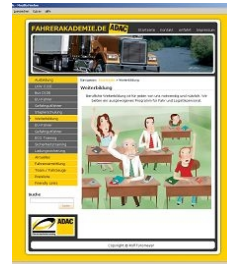
Abbildungen 4 bis 6: Darstellungen von Weiterbildung.

Im Folgenden soll mittels der dokumentarischen Bildanalyse (Bohnsack 2009) ein genauerer Blick auf die Klassenraumkarikatur (Abbildung 6) geworfen werden, da sich in ihr zwei bildhafte Diskurse gewissermaßen kreuzen bzw. brechen: der schulische und der weiterbildungsbezogene. Eine genauere Analyse dieser Karikatur verspricht insofern Aufschlüsse über das Verhältnis dieser beiden Diskursarenen im Kontext einer Ikonographie des lebenslangen Lernens.