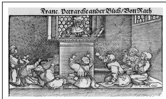
Abbildung 8: Petrarca aus Pictura paedagogica online

Wechselt man zur ikonographischen Einstellung , ist man daran interessiert, welche typischen Motive verwendet werden, in welche (institutionellen) Kontexte das Bild typischerweise gestellt ist und vor allem daran, welche Narrative zu dem Bild existieren. Die Illustratorin greift, um ein Weiterbildungsszenario darzustellen, zum einen auf ‚typische Schulmotive‘ zurück, wie sie sich in der Ikonographie schulischen Lernens und Unterrichtens in einem Jahrhunderte dauernden Prozess ausdifferenziert haben. So lassen sich etwa die bekritzelten Schultische und -bänke oder die Meldeaktivitäten in vielen medialen Darstellungen von Schulsituationen wieder finden (für Schulbilder: vgl. Schiffler/Winkler 1999; Kirk 2004; Schäffer 2005; für Schulspielfilme: Schäffer 2003a). Aber auch der nach oben gerichtete Blick der ‚Schüler‘ auf einen in der Karikatur nicht sichtbaren Katheder ist bspw. bereits im Kontext mittelalterlicher Schuldarstellungen zu finden und zieht sich auch durch andere Unterrichtsdarstellungen (vgl. expl. Abbildung 8).