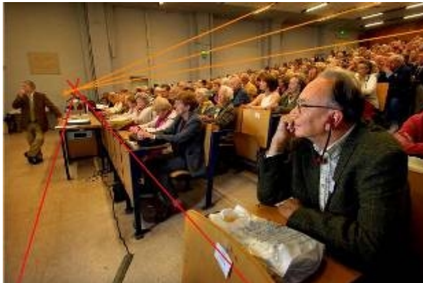
Abbildung 6: Fluchtpunkt

Was bei der Rekonstruktion der perspektivischen Projektion auffällt, ist die starke räumliche Wirkung des Bildes. Sie entsteht durch eine Zentralperspektive mit einem bzw. mit zwei Fluchtpunkten, wobei der zweite Fluchtpunkt marginalisiert werden kann, da er weit außerhalb des Bildes liegt.