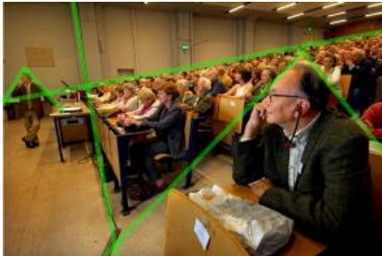
Abbildung 4: Dominante Bildlinien

Die ikonische Interpretation gehört zur formalen Rekonstruktion des Bildes und zielt mit der Analyse der Bildkomposition auf die ausschließlich bildhaften Elemente des Bildes. Dieser Schritt dient dazu dem Bild in seiner Eigengesetzlichkeit gerecht zu werden.