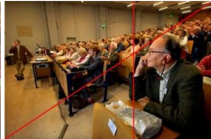
Abbildung 5: Goldener Schnitt

In Hinsicht auf die planimetrische Kompositionsanalyse treten einige Auffälligkeiten zutage. Die Gesamtkomposition ist bestimmt durch eine Linie oberhalb der Menschenmenge, die sie scharf von der baulichen Struktur des Saales trennt (siehe Abbildung 4). Eine weitere Linie, folgt der Schattenmarkierung des ersten Pfeilers und wird aufgenommen in dem Verlauf des Kabels am Boden und der Unterkante der ersten Stuhldreie. Beide Markierungen trennen die Menschen und den Saal voneinander. Diese Linien sind als Grenzen geprägt durch die Kontraste zwischen Gedränge und Freiraum, bunt und einfarbig,