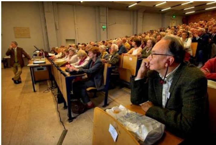
Abbildung 1: Foto auf der Seite des Audiovisual Service der Europäischen Kommission.

Als ein Beispiel des bildhaften Diskurses von LLL wird sich nun einem Bild gewidmet, welches zu dieser Thematik veröffentlicht wurde. Um nun die sich in dem Bild explizit sowie implizit dokumentierenden als auch die spezifisch bildhaft enthaltenen Inhalte dieses Abbildes zu erfassen, wird dieses einer vertiefenden dokumentarischen Bildanalyse unterzogen. Das untersuchte Bild (Abbildung 1) findet sich auf den Webseiten der Europäischen Kommission.